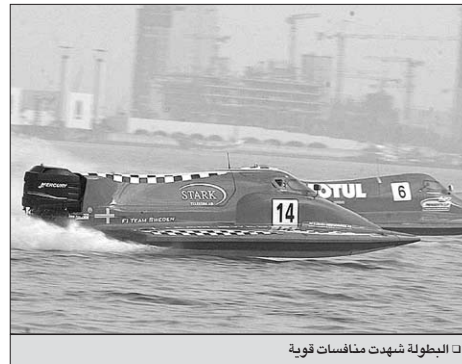
البطولة شهدت منافسات قوية

وقد جاءت انطلاقة السباق الرئيسي التي حضرها سعادة